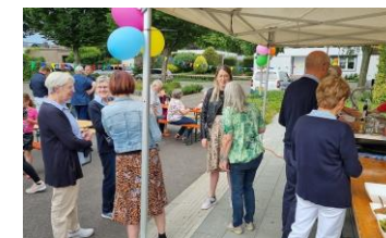
2022 - Feest in de Grasbroekstraat

Het jaarlijkse buurt-straatfeest voor alle leden en buurtbewoners vindt op 9 juli plaats in de Maaslandstraat. Het feest is van 15.00 tot 19.00 uur. Er wordt gezorgd voor zitjes, drankjes, een barbecue, een kraampje en een springkussen voor de kinderen.